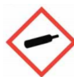
Баллон для газа [9]