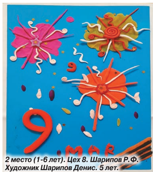
2 место (1-6 лет). Цех 8. Шарипов Р.Ф. Художник Шарипов Денис, 5 лет.