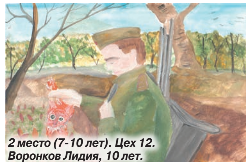
2 место (7-10 лет). Цех 12. Воронков Лидия, 10 лет.