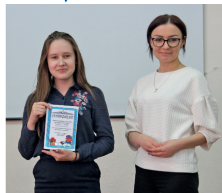
Самые внимательные ученики получили сертификаты в книжный магазин

Чтобы сделать уроки максимально интересными и насыщенными, организаторы включили в программу помимо теоретического материала практические занятия, просмотр видеороликов, а на уроках по ОТиПБ и ГОиЧС ученики смогли примерить разные виды спецодежды. Кроме этого школьникам предложили ответить на вопросы викторины, состав-