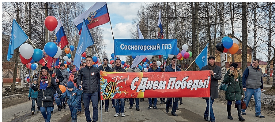
Участники праздничного парада, посвященного Дню Победы, работники Сосногорского ГПЗ

Сосногорский ГПЗ принял активное участие в мероприятиях, посвященных празднованию Дня Победы в Сосногорске и Сосногорском районе.