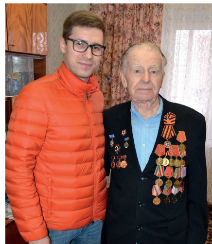
Члены Совета молодых ученых, рабочих и специалистов встретились в преддверии Дня Победы с ветеранами