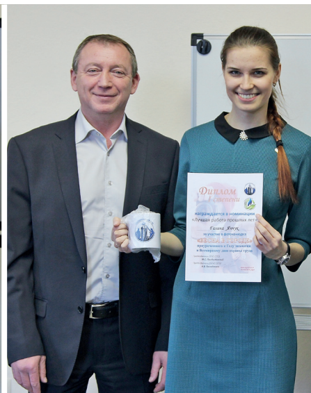
Награждения обладателей первых премий