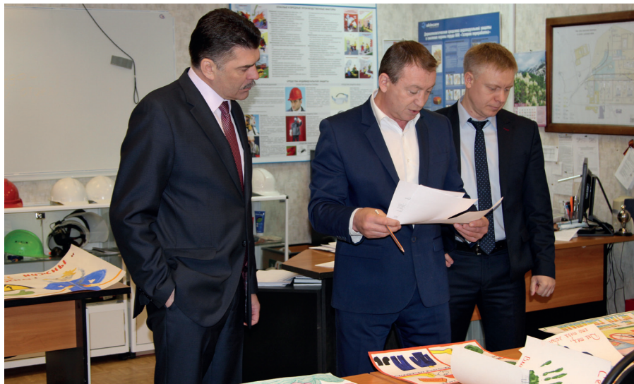
Члены комиссии высоко оценили творчество заводчан и их детей

24 мая на Сосногорском ГПЗ подвели результаты юбилейного, пятого по счету смотра-конкурса «Лучший агитационный материал, пропагандирующий соблюдение требований охраны труда» среди работников Сосногорского ГПЗ ООО «Газпром переработка», посвященный Всемирному дню охраны труда. Именно завод явился инициатором этого конкурса, проведенного впервые в 2012 году.