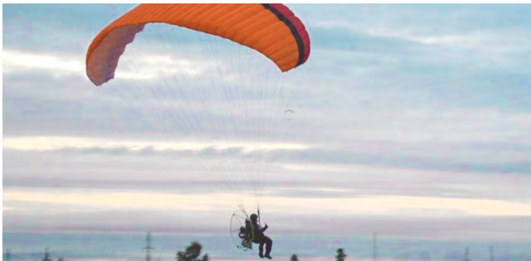
Незабываемый полет на парaparplane

- Вспоминая об истории праздника, можно подготовить подарки, символизирующие мужественность и силу: сувенирное оружие, спортивные тренажеры, мужские аксессуары. Для мужчин - коллекционеров подойдут макеты военной техни-