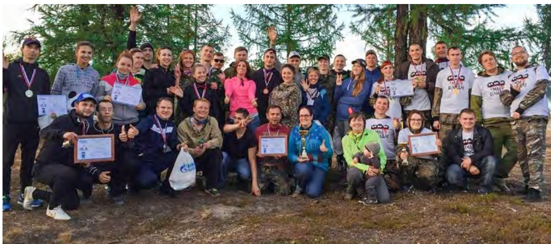
"Турфест ЗПКТ – 2016"