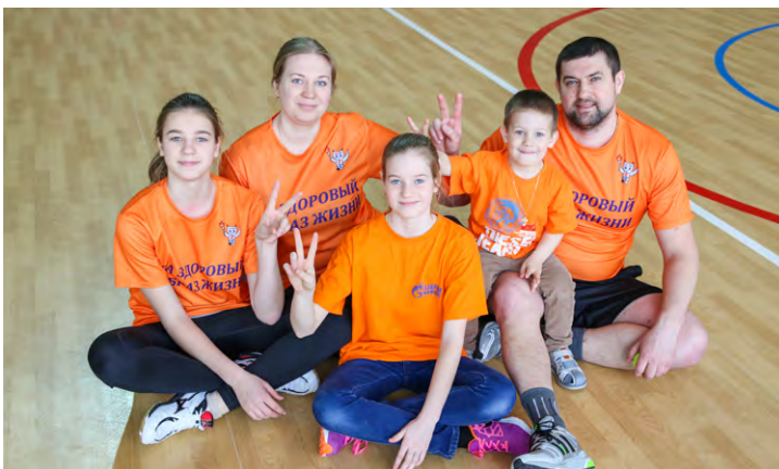
«Наша дружная спортивная семья»