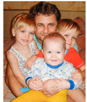
«Папины сыночки», фоторабота Виктора Богаевского

Победители конкурса были награждены дипломами и сувенирами.