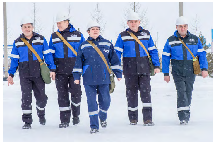
Уполномоченные по охране труда

Кроме того, в минувшем году на заводе были успешно проведены соревнования по пожарно-прикладному спорту среди подразделений, в них активно участвовало 16 команд; прошли акции «Скажем «Да!» охране труда», «Лучшая SMS идея». Среди