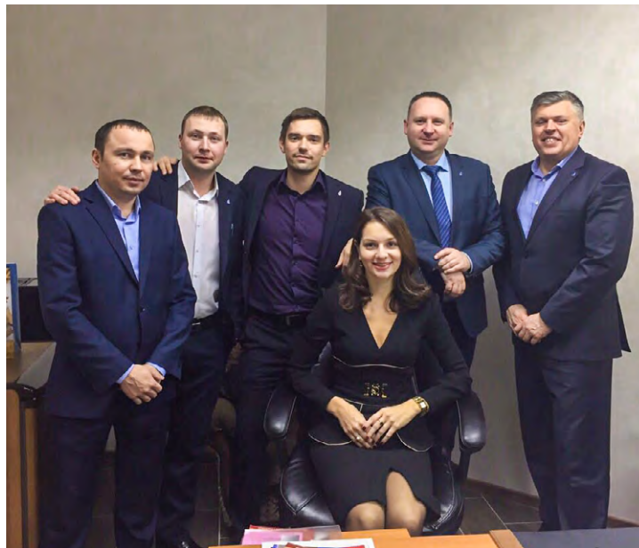
Отдел в полной боевой готовности!

Коллегам подарите свое хорошее настроение и годовой отчет!