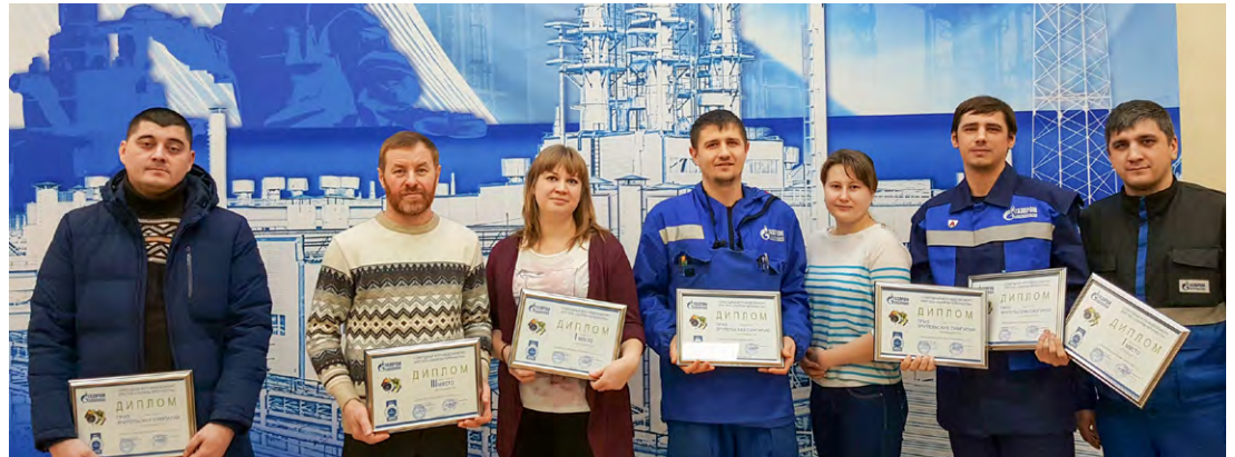
Победители V ежегодного фото-видеоконкурса «ЗПКТ-2016»