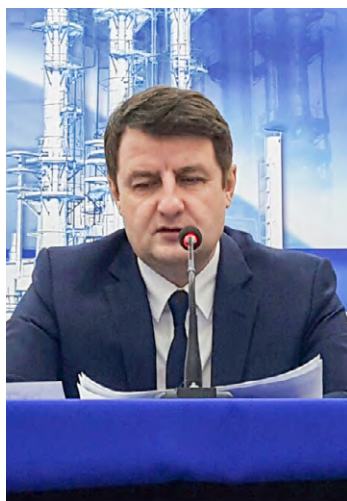
Подведение итогов производственной деятельности

В течение четырех дней на ЗПКТ проходили традиционные ежеквартальные собрания работников завода, в которых принимали участие сменный и инженерно-технический персонал, руководители подразделений и отделов аппарата управления. Поскольку специфика производства со сменным графиком работы не позволяет коллективу собираться в полном составе одновременно, такие поэтапные встречи позволяют работникам оставаться в курсе важнейших производственных событий и предоставляют возможность задать актуальные вопросы непосредственно специалисту, курирующему то или иное направление деятельности.