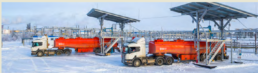
ЗПКТ.Наливная эстакада. Отгрузка топлива для реактивных двигателей марки ТС-1 ■