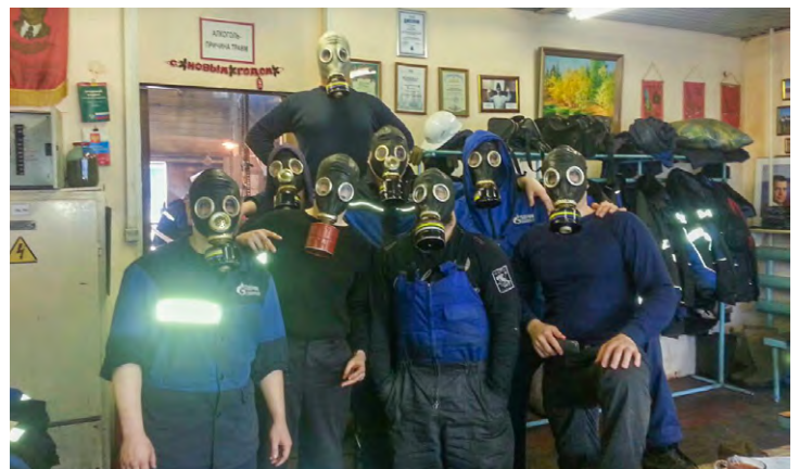
Приз зрительских симпатий - «Команда – «Газы!»