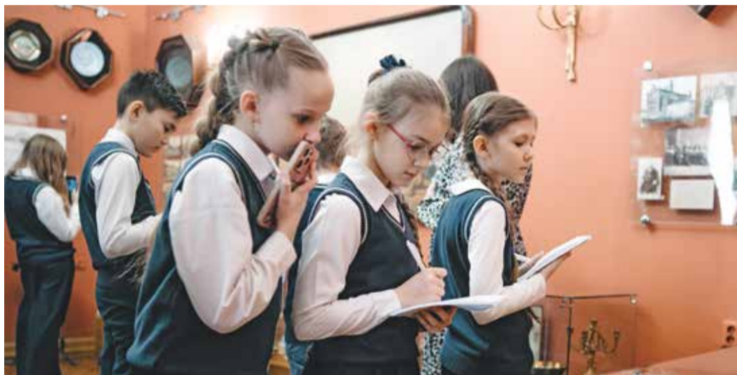
Свежие идеи — на карандаш