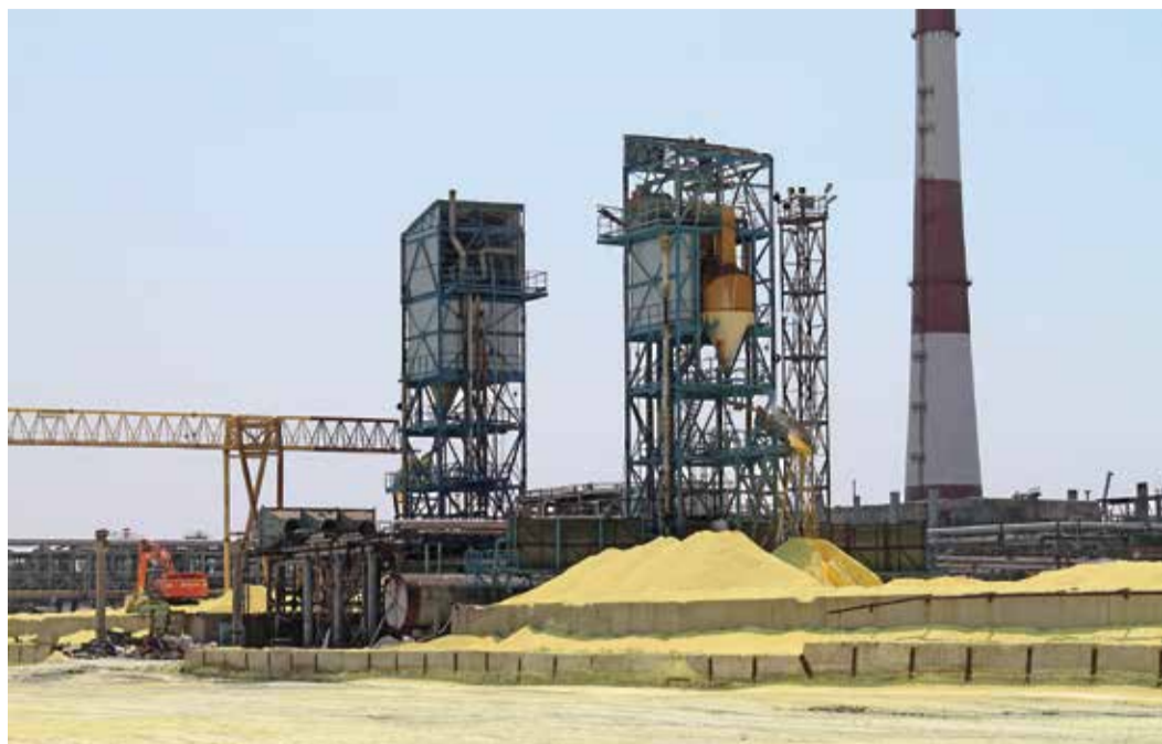
Установка получения серы

Продолжаем цикл статей, посвященных истории Астраханского ГПЗ и его руководителям, каждый из которых внес вклад в развитие предприятия