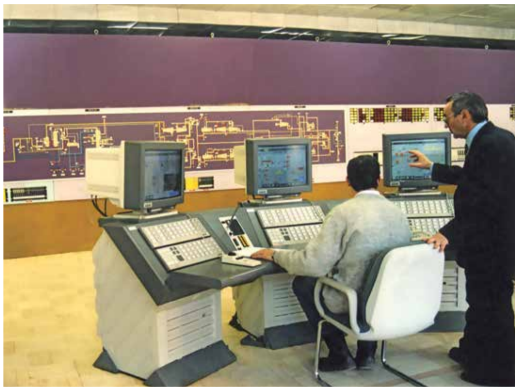
Центральная операторная Астраханского ГПЗ

В начале XXI века страна взяла новый курс на развитие. Глобальные изменения произошли и в газовой отрасли, которая стала флагманом российской экономики. Было положено начало эпохе перемен, техническому перевооружению и модернизации производственных мощностей.