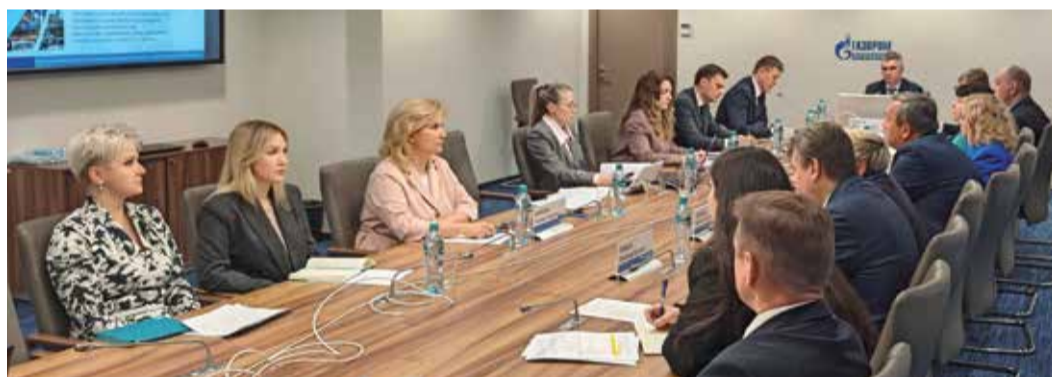
Итоговая конференция трудового коллектива компании в Санкт-Петербурге

Во всех филиалах «Газпром переработки» прошли встречи руководства компании с трудовыми коллективами. Начало диалогу было положено в Новом Уренгое, после чего обсуждения продолжились в Ноябрьске, Сургуте, Оренбурге, Сосногорске и завершились в Санкт-Петербурге.