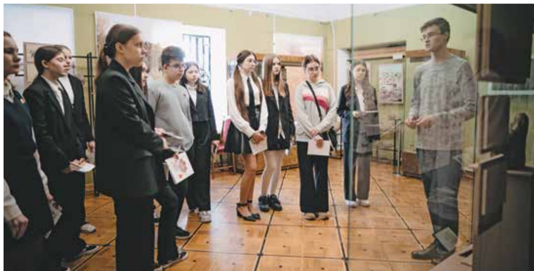
На интерактиве «Мастерство экскурсовода»