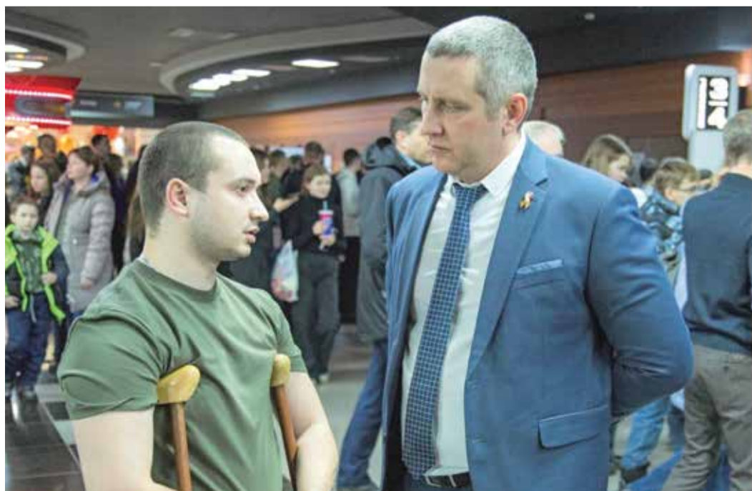
На Оренбургском ГПЗ поздравили участников СВО с 23 Февраля