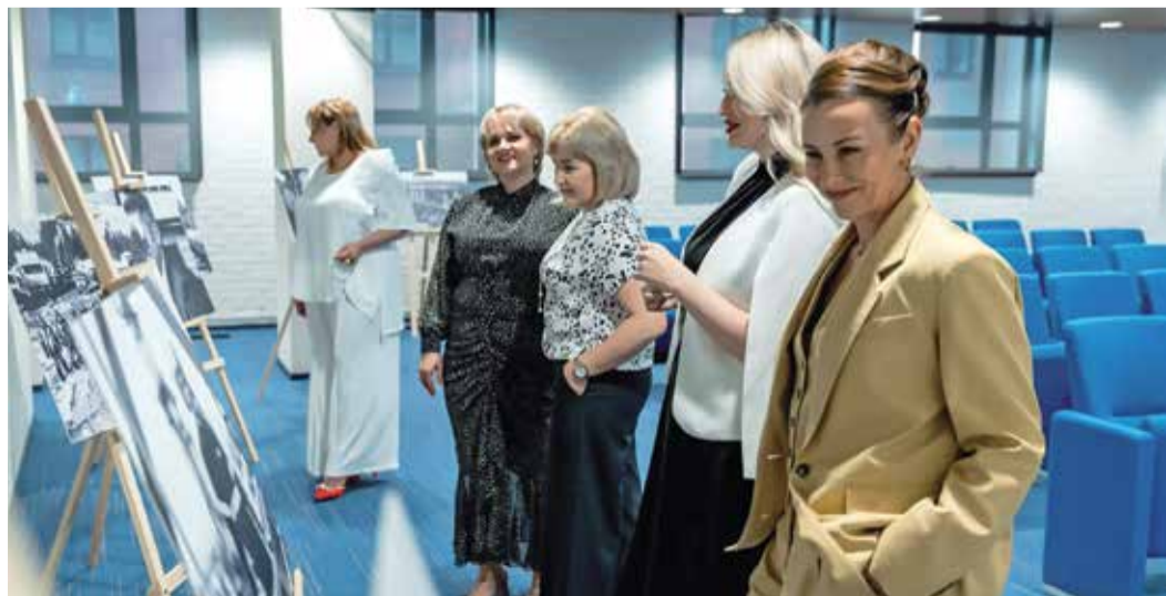
В администрации компании

Выставка «Курс на развитие» опубликована на корпоративной платформе ГИД.