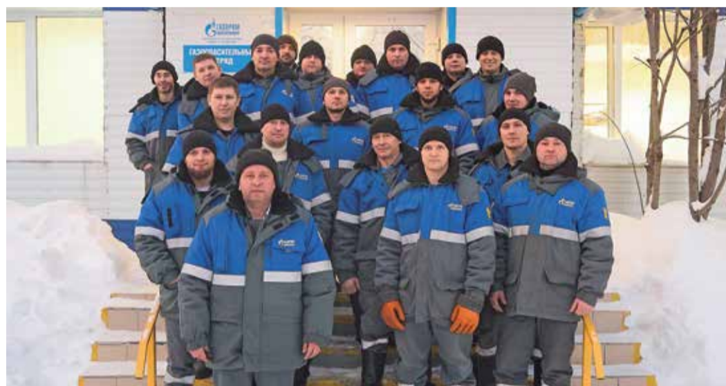
Коллектив газоспасательного отряда