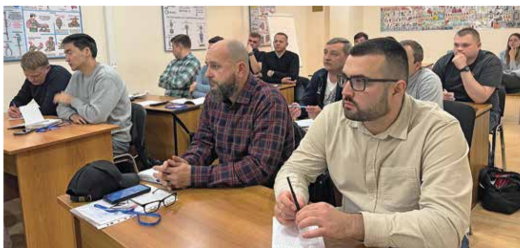
Слушатели авторского курса преподавателя РГУ