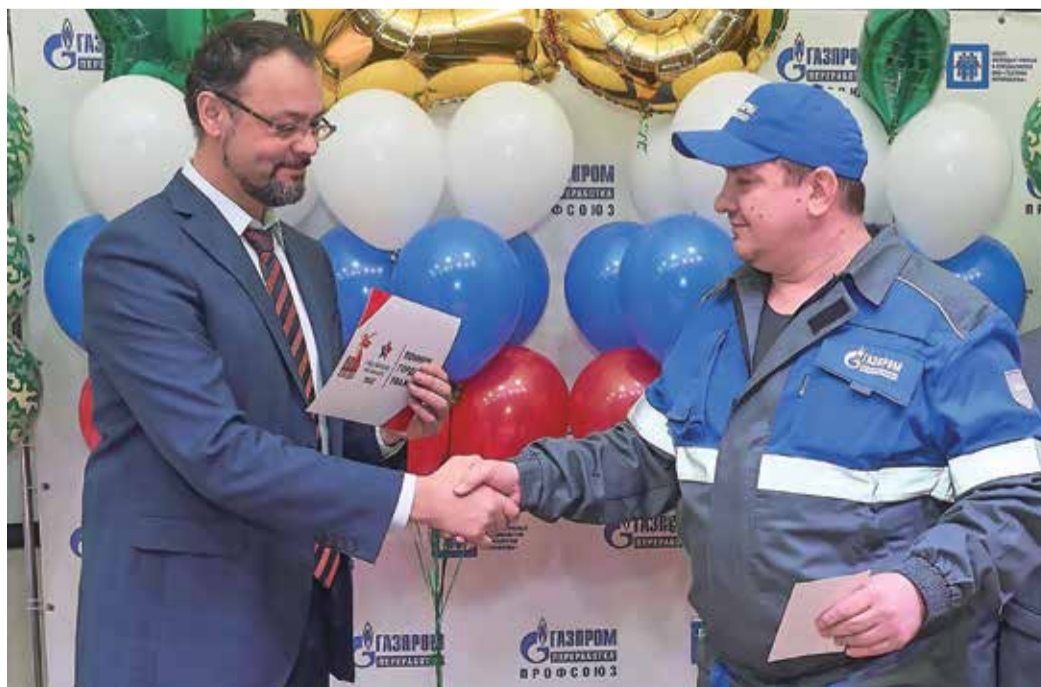
Награждение на Заводе по подготовке конденсата к транспорту