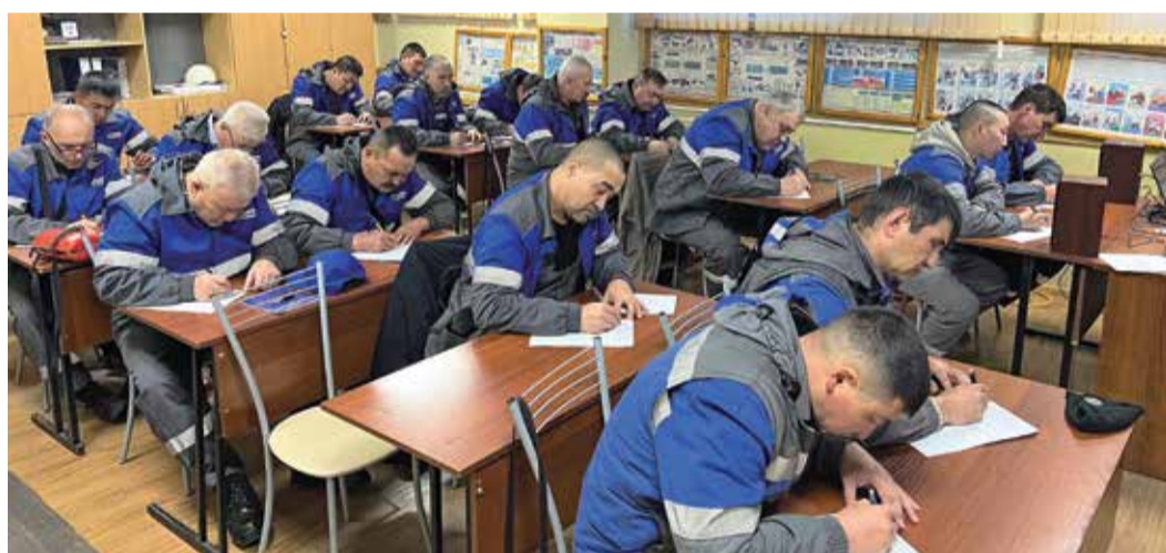
Обучение водителей транспортного цеха