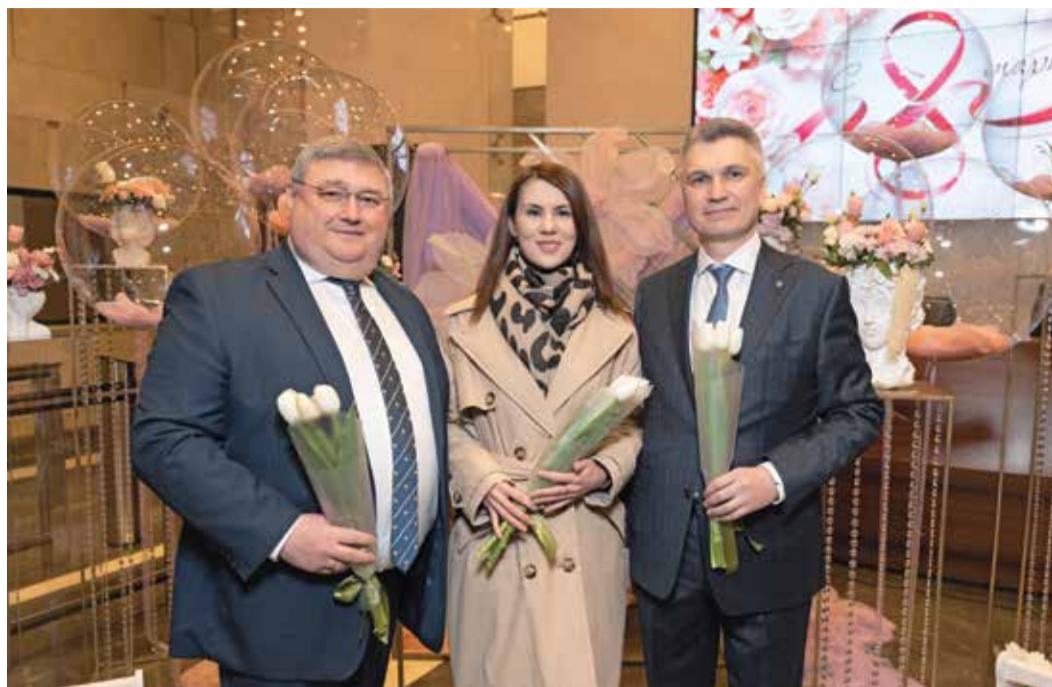
Праздничное утро 8 марта в администрации компании