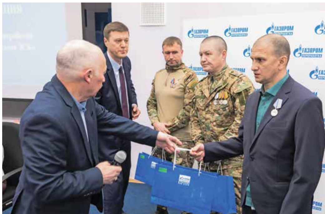
Поздравление с 23 Февраля на Сургутском ЗСК

Также в Санкт-Петербурге прошло праздничное собрание, на котором 14 лучших работниц компании были удостоены званий и наград. Еще одним подарком стала выставка фоторабот «Курс на развитие».