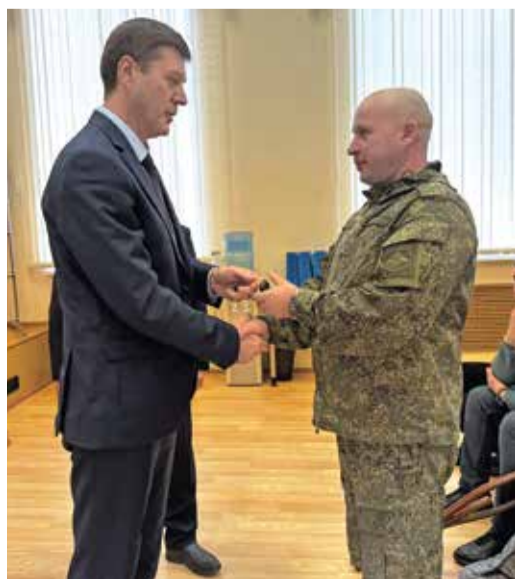
Торжественное вручение ключей

Оренбургский газоперерабатывающий завод снова подтверждает свое лидерство в компании «Газпром переработка» по объему отправленной в зону конфликта гуманитарной помощи. Недавно в Курскую и Белгородскую области был доставлен уже третий с начала года конвой.