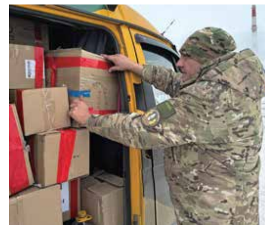
Отправка гуманитарной помощи

Недавно компания «Газпром переработка» передала 73-му зенитно-ракетному полку автомобиль «УАЗ Патриот», который ранее эксплуатировался на Оренбургском газоперерабатывающем заводе. Этот внедорожник был подготовлен силами сотрудников транспортного цеха, а также оснащен средствами радиоэлектронной борьбы, приобретенными на добровольные пожертвования заводчан.