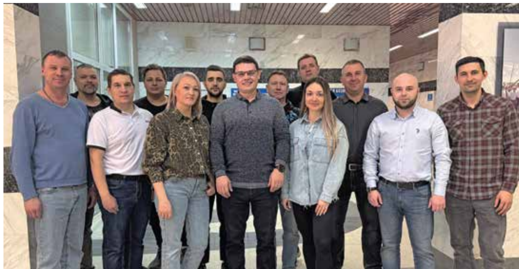
Участники курса на Астраханском ГПЗ

«Сотрудники узнали о фундаментальных основах и принципах культуры безопасности. Закрепили полученную информацию на практических занятиях. Совместно с коллегами мы разобрали конкретные случаи, с которыми сталкивались в жизни и на производ-