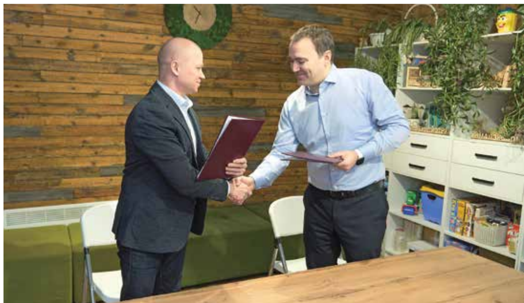
Профсоюз ЗПКТ и компания «Ямал Экология» договорились сотрудничать в сфере экологического просвещения