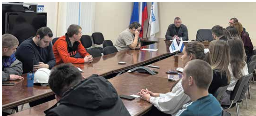
Отчетно-выборная конференция СМУС на Сосногорском ГПЗ