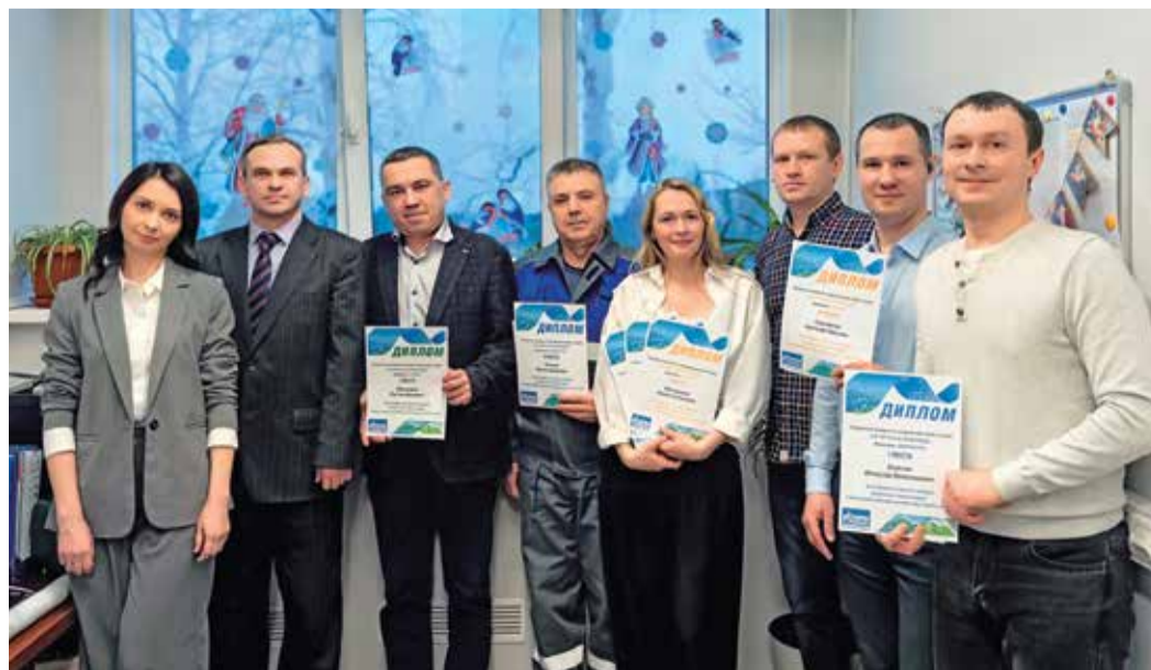
Награждение участников семейного конкурса на Сургутском ЗСК