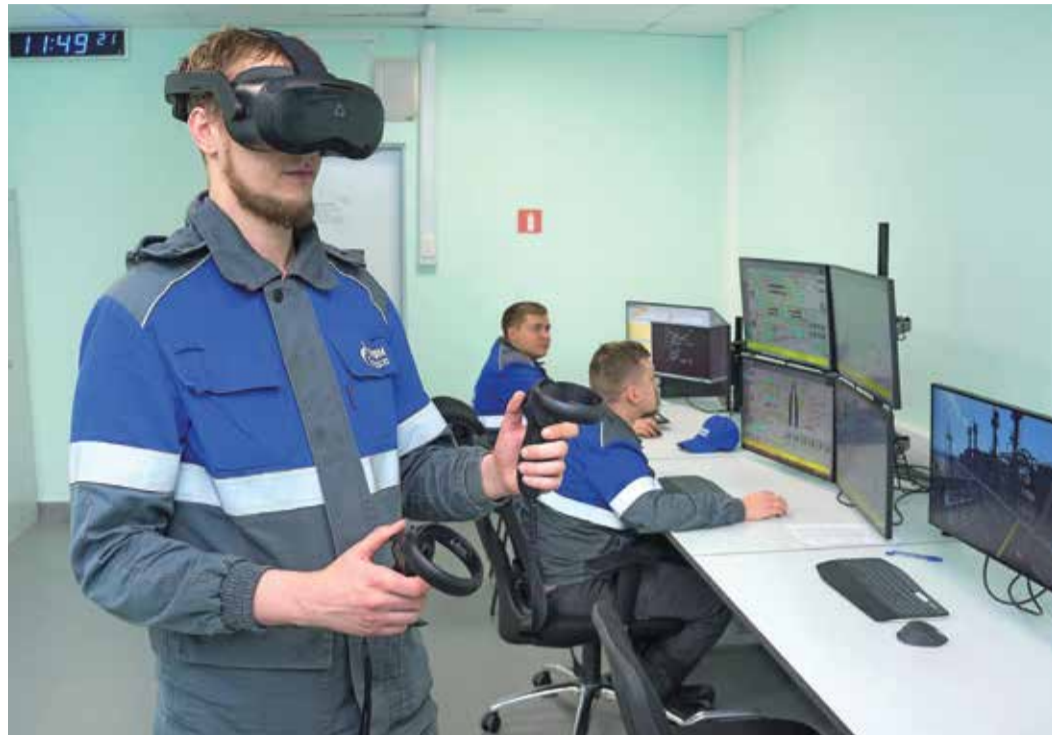
Работники ЗПКТ уже приступили к обучению на тренажерном комплексе

Одним из значимых событий прошлого года стало завершение строительства и ввод в эксплуатацию установки деэтанализации конденсата в Новоуренгойском филиале компании «Газпром переработка». На этом производственном объекте значительно усовершенствован технологический процесс, внедрены самые смелые идеи российских инженеров, одна из которых — компьютерный тренажерный комплекс (КТК) с применением технологий виртуальной реальности отечественных производителей.