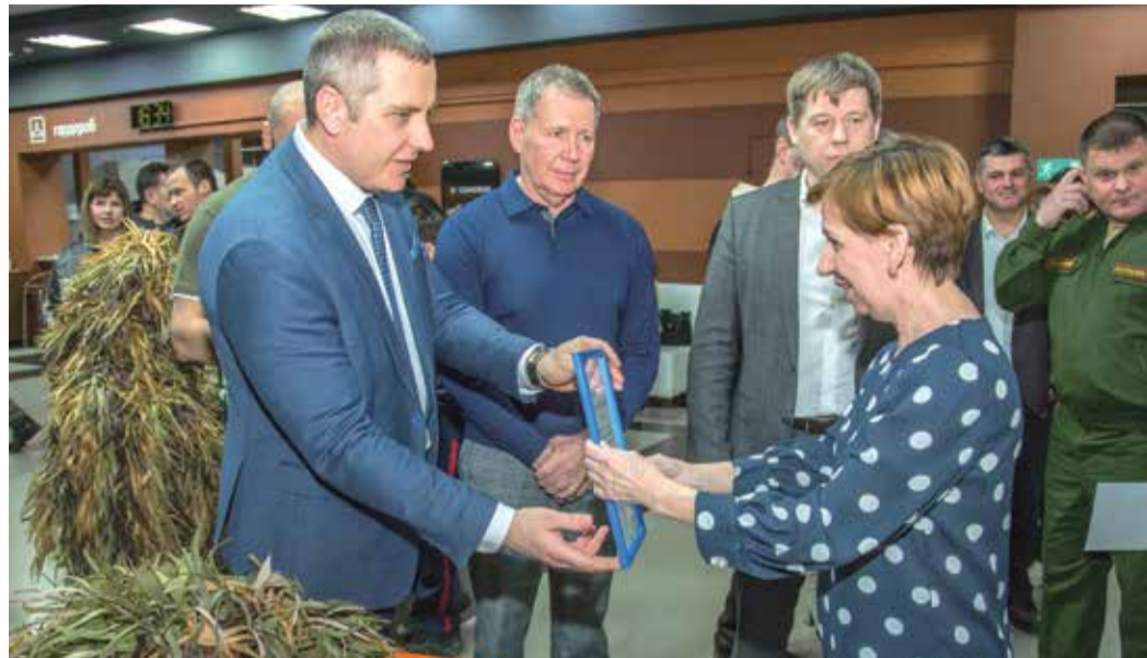
Волонтерские группы получили благодарственные письма от руководства Оренбургского ГПЗ

Концертную программу проникновенным прочтением стихотворения Марины Смирно-