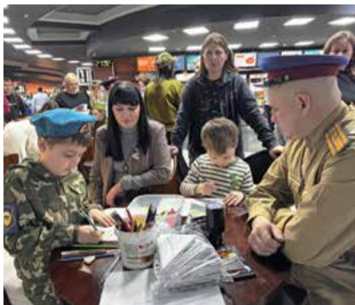
Во время акции «Письмо солдату»