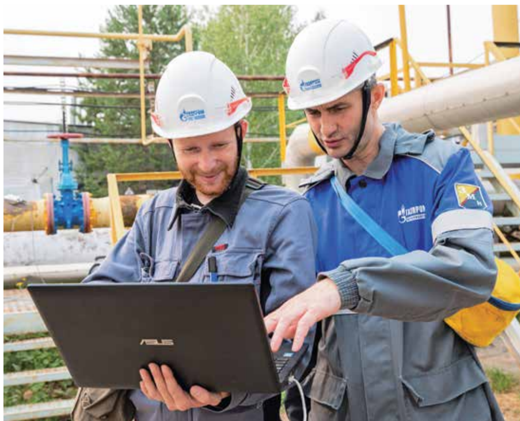
Мониторинг параметров испытания газопровода на Сургутском ЗСК