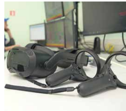
Функция виртуальной реальности позволяет максимально погрузить в обучающий процесс

«Используемые в КТК УДК-1 цифровые технологии послужат филиалу драйвером развития. Мы будем совершенствовать подходы к обучению и повышению качества подготовки оперативного персонала навыкам безопасного ведения технологического процесса», — отметил Руслан Койшин.