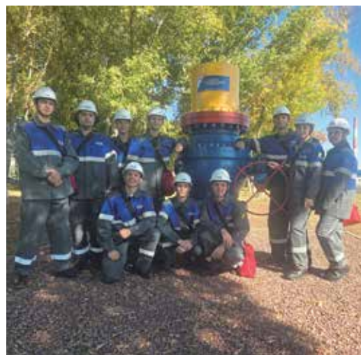
Участники стажировки на Оренбургском ГПЗ

В рамках образовательной программы «Технологический сервис газопереработки» десять студентов магистратуры Казанского национального исследовательского технологического университета прошли стажировку на Оренбургском газоперерабатывающем заводе.