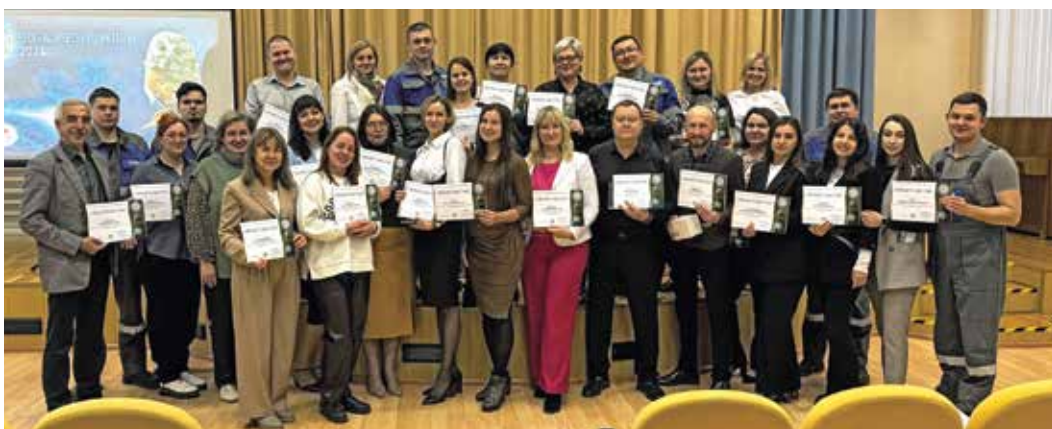
Участники «Географического диктанта» на Оренбургском ГПЗ

Сотрудники компании «Газпром переработка» стали участниками Международной просветительской акции «Географический диктант», которая ежегодно проходит в середине ноября под эгидой Русского географического общества.