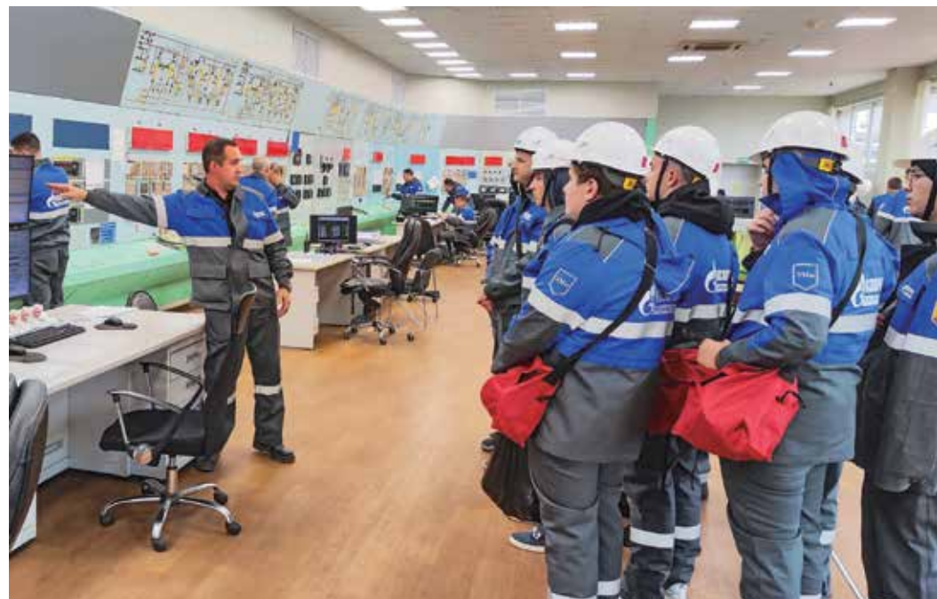
Экскурсия на Оренбургский ГПЗ

В Оренбурге и Астрахани прошли профориентационные мероприятия для учеников «Газпром-классов».