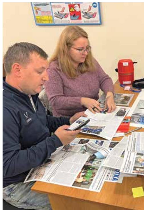
Выполнение практического задания

Курс «Анализ коренных причин происшествий в области безопасности труда» провел преподаватель «Газпром корпоративный институт», представитель компании «Профконсалт ИСМ»