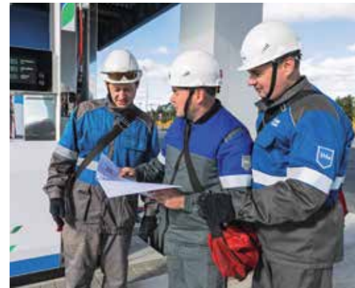
В ходе пусконаладочных работ на АЗС Сургутского ЗСК

«Реализация программы по созданию газозаправочной инфраструктуры на промышленных площадках дает значительные преимущества, позволяет экономить ресурсы. Прежде всего, за счет сокращения «холостого» пробега. Заводской парк автотранспорта на КПГ за последние шесть лет увеличился почти в шесть раз, а единственная газовая станция в Сургуте находится на расстоянии 35 км от завода. Кроме того, сокращается время заправки и повышается эффективность исполь-