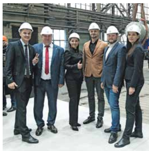
Торжественная отгрузка оборудования

«Сегодняшнее событие – это хорошая иллюстрация того, насколько важна совместная работа отечественных металлургов и машиностроителей. «Северсталь» подтверждает свою