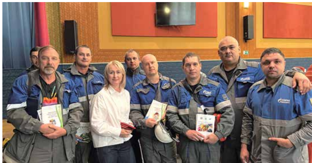
Работники Астраханского ГПЗ

«Не каждый может подобрать систему питания, найти свободное время для спорта, обратить внимание на свое здоровье. Совместно с Центром общественного здоровья и медицинской профилактики мы разработали план мероприятий, который будет реализо-