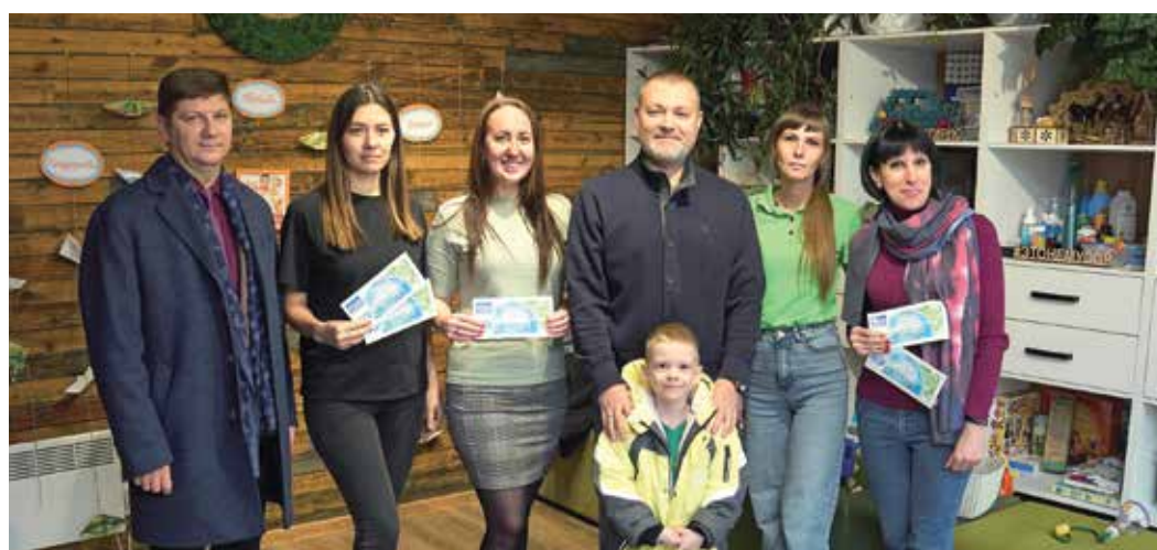
Победители экологического проекта