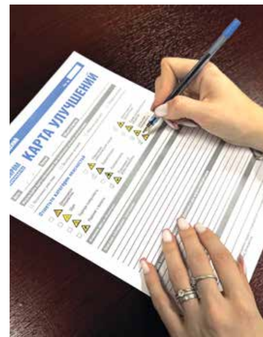
Заполнить «Карту улучшений» может любой работник