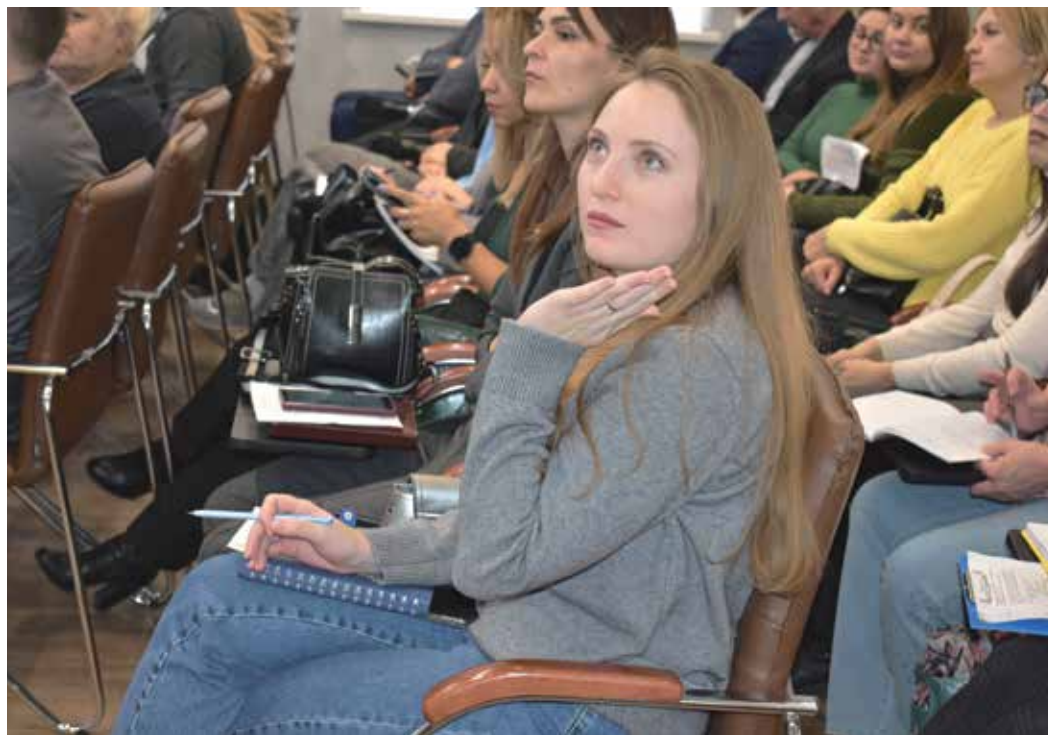
Участниками практикума стали 80 сотрудников предприятий региона

«Нам есть чем поделиться в сфере охраны труда и производственной безопасности, ведь за полувековую историю у нас накоплен богатый опыт. В коллективе многие годы соблюдаются традиции безопасного труда, заложенные предшественниками. Опираясь на них, а также на мировой опыт в этой области мы внедряем и новые, актуальные идеи».