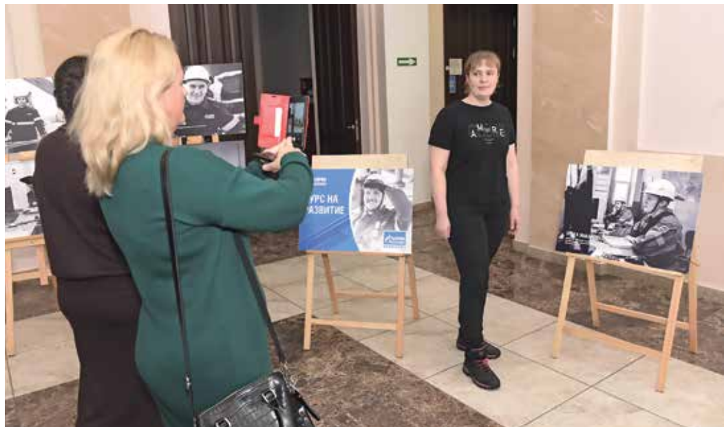
Открытие выставки посетили герои фотографий