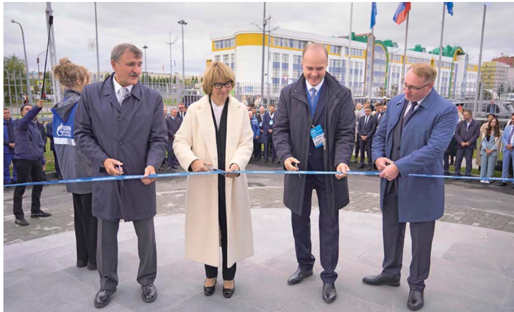
Торжественное открытие учебного полигона в Новом Уренгое

Современная, эффективная и многофункциональная – в газовой столице России появилась новая образовательная площадка. Здесь студенты смогут получить профессиональное образование по рабочим профессиям, школьники – наглядно познакомиться с нефтегазовой отраслью, а работники предприятий топливно-энергетического комплекса – пройти дополнительное обучение.