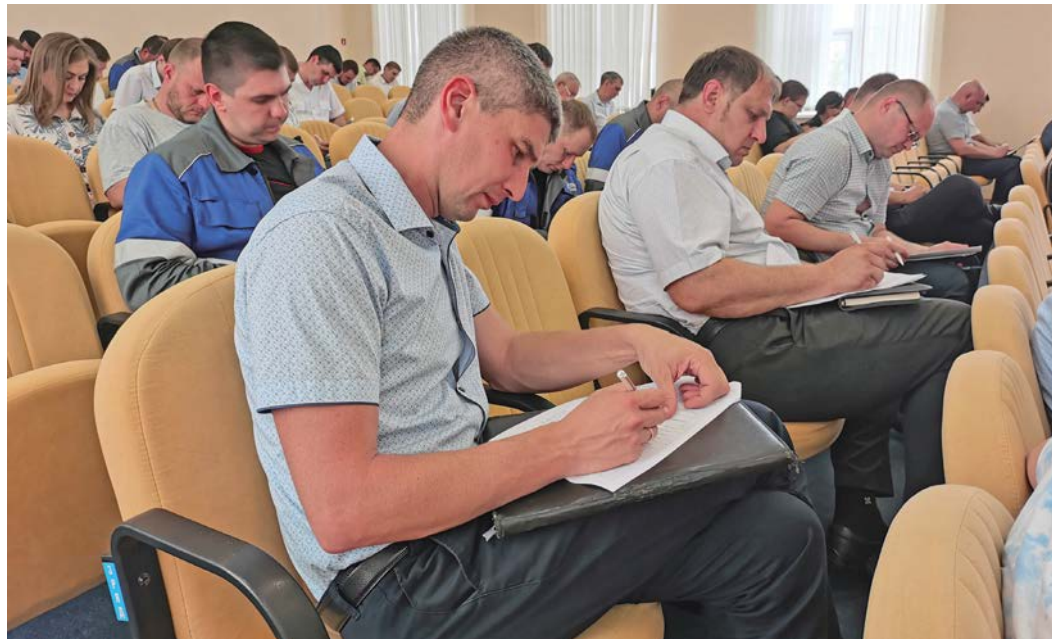
Анкетирование сотрудников на Оренбургском газоперерабатывающем заводе

Если речь идет о таких категориях системы охраны труда и промышленной безопасности, как количество аварий, несчастных случаев или пожаров, то показатель «ноль» — это то, к чему должны стремиться на любом предприятии. Над тем, как к такому результату прийти, не одно десятилетие ломают головы специалисты. Однако все едины в главном: безопасность — это выстроенная система мышления и поведения современного человека.