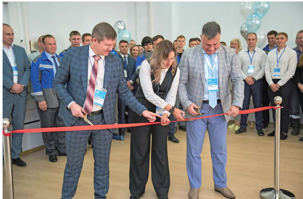
Торжественное открытие музея гелиевого завода

На Оренбургском гелиевом заводе прошли мероприятия, посвященные Дню открытия гелия как химического элемента. К важной исторической дате газовики приурочили научно-техническую конференцию молодых специалистов предприятия, открытие заводского музея и презентацию сборника научных статей работников.