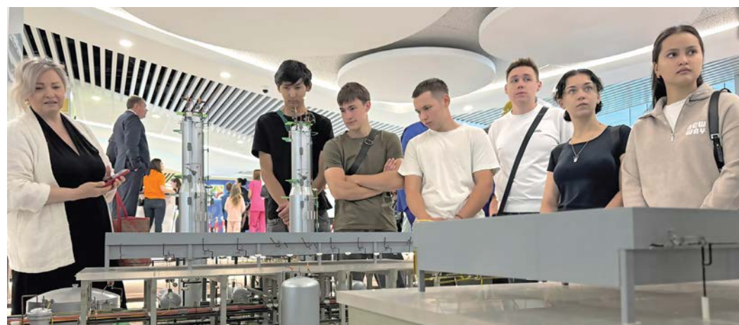
Экспозиция «Газпром переработки» заинтересовала студентов

В степной столице прошел первый региональный форум труда «Живи и работай в Оренбуржье», участниками которого стали ведущие предприятия, учебные заведения области, студенты и школьники – более шести тысяч человек.