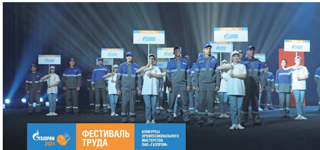
Торжественная церемония открытия