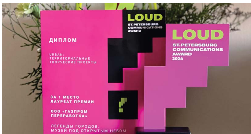
Награда «Газпром переработки» в коммуникационной премии LOUD