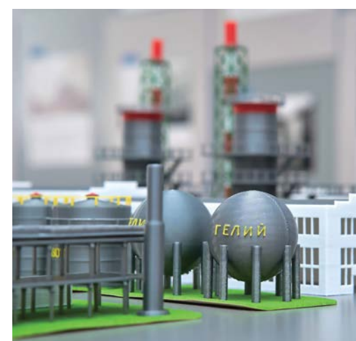
Макет производства гелиевого завода