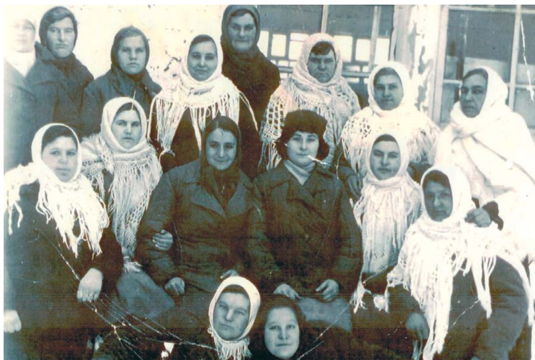
Первая группа высланных немок. Крутая. 1944 г.

По рекомендации Тихоновича было обращено внимание на Ижемский район как наиболее перспективный для разведочного бурения на нефть и газ. Здесь, около деревни Крутая, 5 октября 1932 года была забурена на нефть раз-