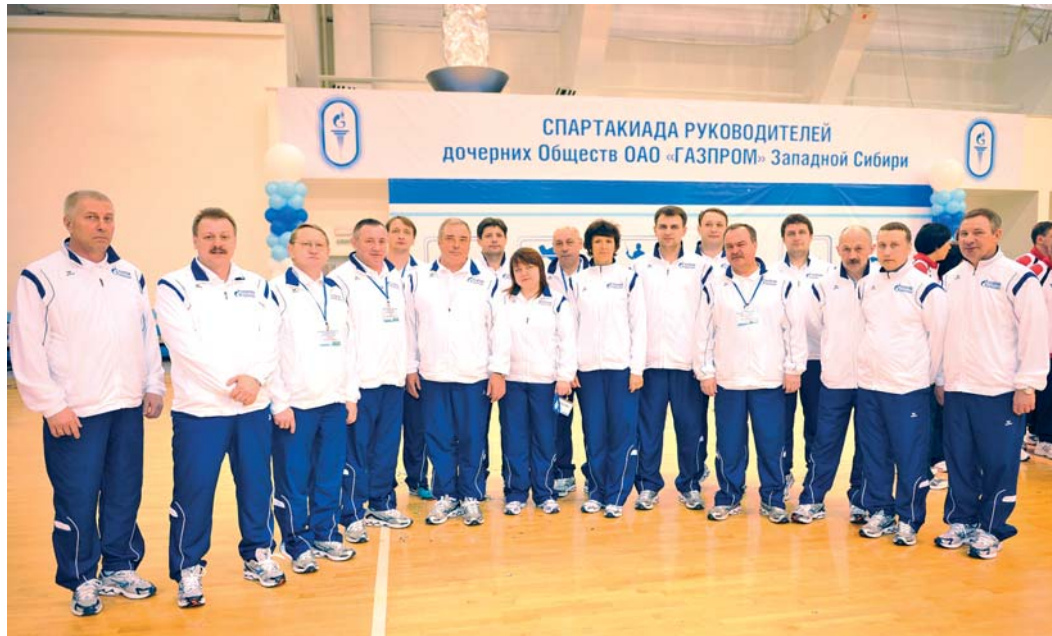
Сборная команда руководителей ООО «Газпром переработка»

итоги югорской Спартакиады руководителей дочерних обществ ОАО «Газпром» Западной Сибири