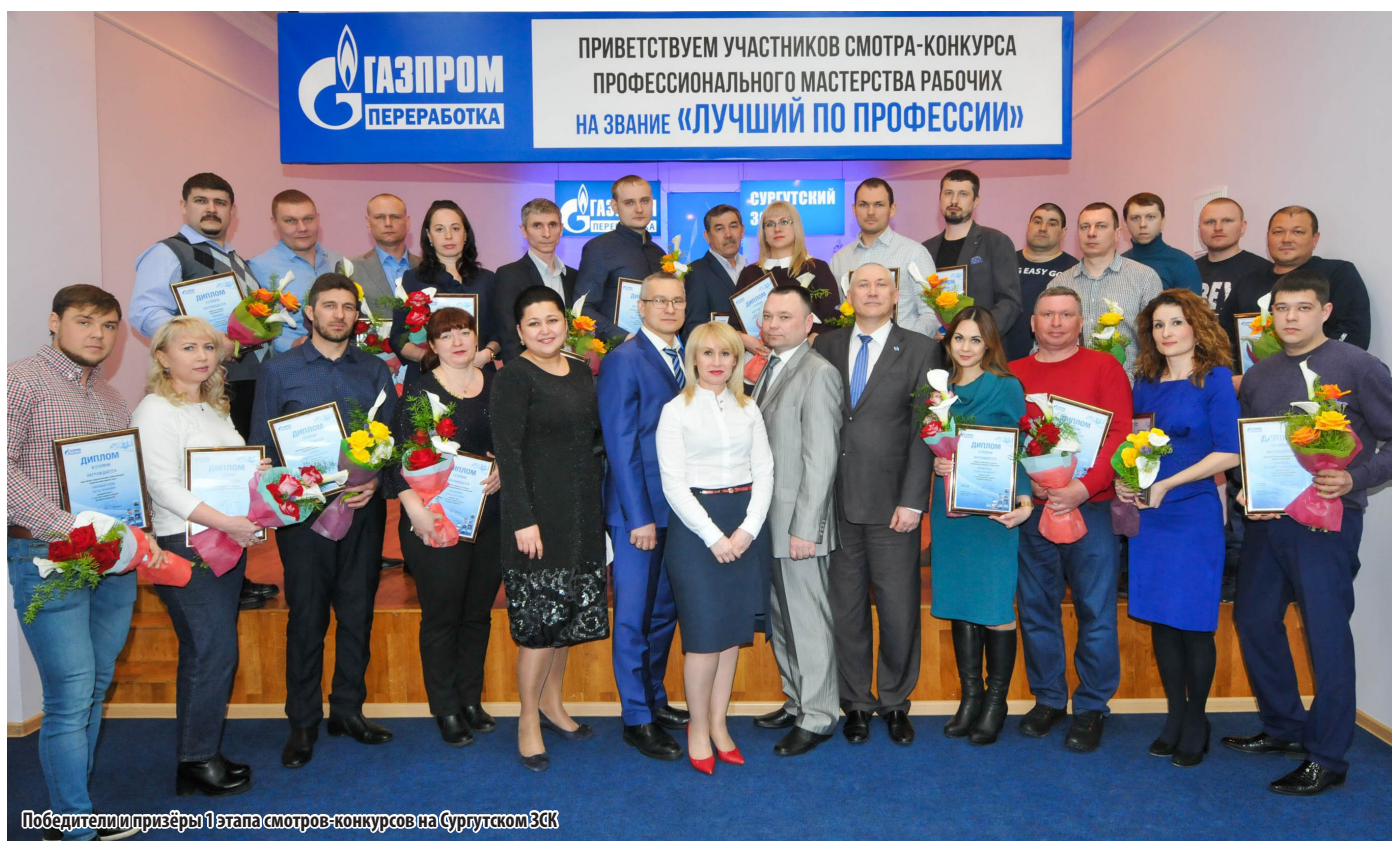
Победители и призёры 1 этапа смотров-конкурсов на Сургутском ЗСК

П одведены итоги 1 этапа смотров-конкурсов профессионального мастерства рабочих на звание «Лучший по профессии».