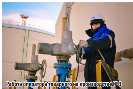
Работа оператора товарного на производстве №3

190 млн. тонн товарной продукции отгружено потребителям со дня основания Сургутского ЗСК.