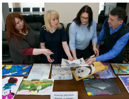
Конкурс рисунков «Юный художник». Отбор рисунков для участия в конкурсе «Юный художник»