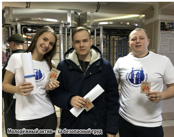
Молодёжный актив – за безопасный труд

Перед началом рабочего дня молодым работникам завода раздавались браслеты с лозунгом дня охраны труда 2018 года – «Безопасность и здоровье нового поколения» и календари с символикой праздника. Активисты СМУС знакомили коллег с тематикой Всемирного дня охраны труда, также запустили