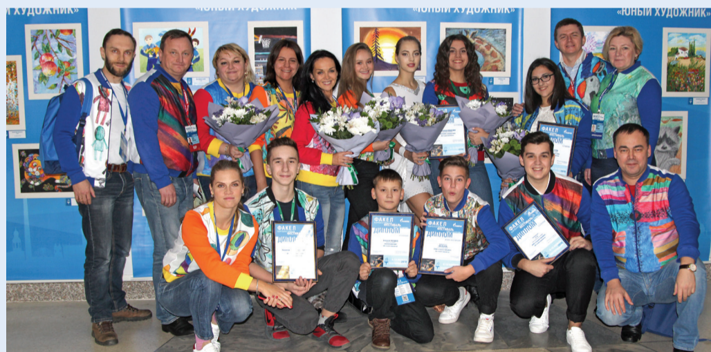
Делегация ООО «Газпром переработка»

Арт-студия «Перспективы» существует с 2001 года. Каждую неделю ее посещают более 40 людей с тяжелой инвалидностью, постоянно проживающих в интернате.