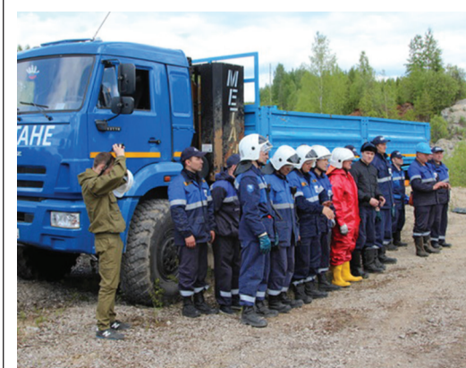
Экологичный автотранспорт на Сосногорском газоперерабатывающем заводе