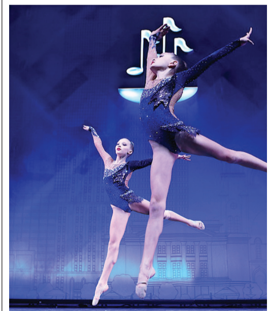
«Газпром нефтехим Салават»