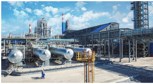
Компания «Газпром нефтехим Салават» в лидерах