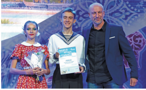
Студия народного танца «Волжские зори» «Газпром добыча Астрахань»

В Екатеринбурге завершился зональный тур фестиваля «Факел» для предприятий северной зоны. В конкурсе самодельных творческих коллективов и исполнителей дочерних обществ и организаций ПАО «Газпром» приняли участие более 800 артистов из 20 дочерних обществ ПАО «Газпром».