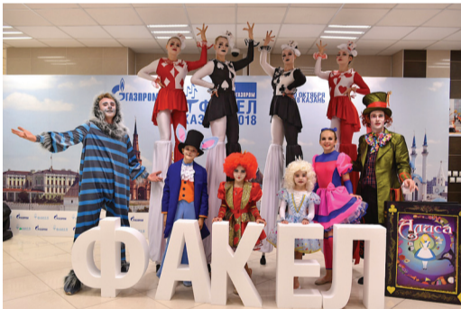
Эстрадно-цирковой театр «Иллюзион» ООО «Газпром добыча Оренбург»