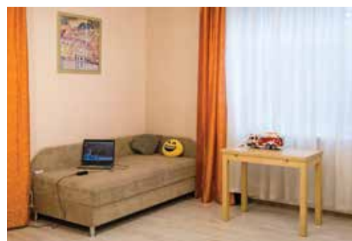
Личное пространство важно каждому