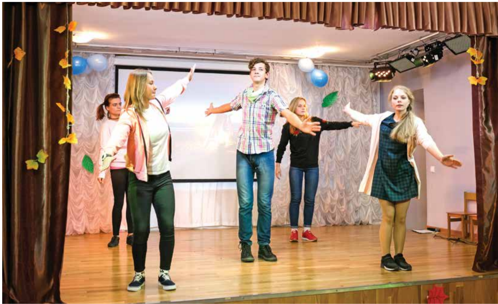
Дети подготовили концерт в знак благодарности

В благотворительности, как и в любой сфере, существуют свои технологии и актуальные течения. Развиваются и социальные учреждения, в том числе детские. Сегодня на первый план выходит такая важная проблема, как социальная адаптация детей-сирот и детей, оставшихся без попечения родителей. Эти дети, живя в специализированных учреждениях на всем готовом, выходят во взрослую жизнь совершенно неприспособленными, несамостоятельными. Такие «предустановленные» навыки взрослого человека, как использование бытовой техники, не говоря уж о планировании бюджета, выпускникам детского социального учреждения приобрести попросту нелегко.