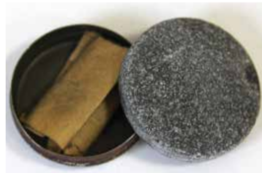
В старой потертой коробочке из-под вазелина лежала записка из прошлого