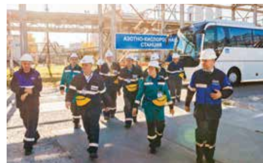
На территории производства № 1

ческого взаимодействия, что особенно актуально в свете запланированного на 2019 год ввода в эксплуатацию завода «ЗапСибНефтехим» – крупнейшего современного нефтехимического комплекса в России. Проект реализуется в г. Тобольске и направлен на развитие глубокой переработки значительных объемов продуктов нефтегазодобычи Западной Сибири, в том числе попутного нефтяного газа, и импортозамещение наиболее востребованных на российском рынке полимеров.