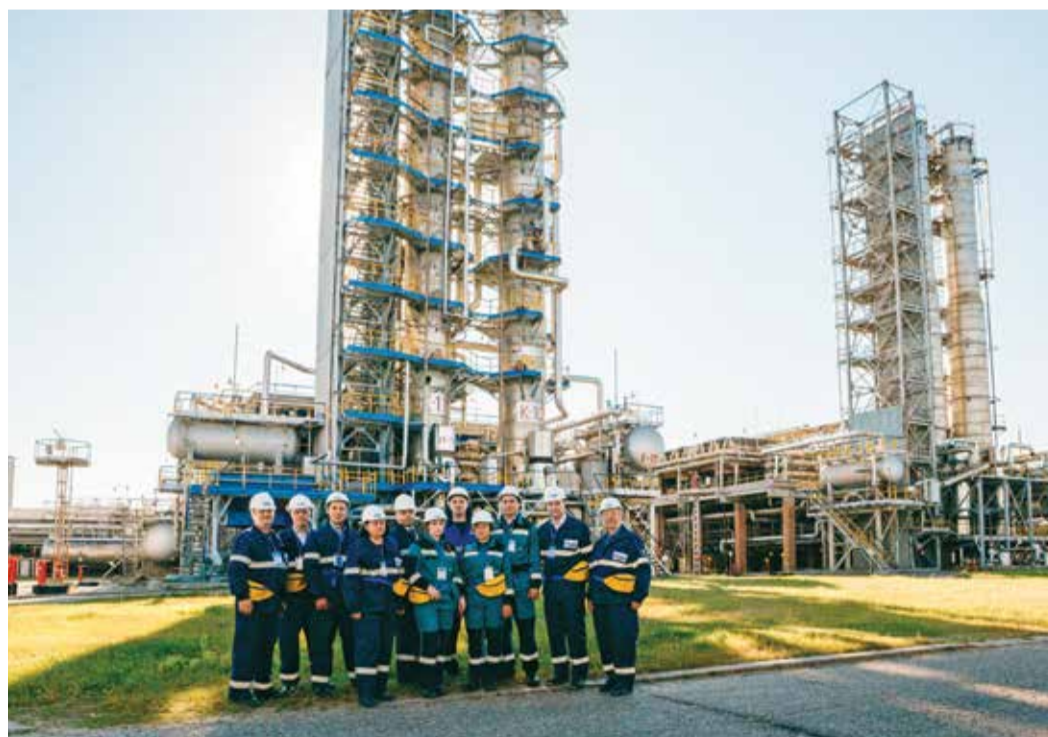
Общее фото на промышленной площадке Сургутского ЗСК

Представители ПАО «СИБУР холдинг» посетили промышленную площадку Сургутского филиала ООО «Газпром переработка». В состав делегации вошли руководители и специалисты структурных подразделений компании: ООО «СИБУР Тобольск», ООО «ЗапСибНефтехим», АО «СибурТюменьГаз». Ранее рабочая группа в составе представителей ПАО «Газпром», Администрации ООО «Газпром переработка» и Завода по стабилизации конденсата имени В. С. Черномырдина посетила промышленную площадку ООО «СИБУР Тобольск».