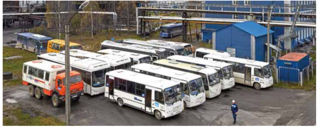
Построение эвакуационной колонны на Сосногорском ГПЗ