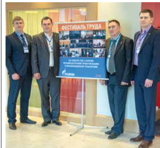
Специалисты компании ООО «Газпром нефтехим Салават» на Фестивале труда ПАО «Газпром»