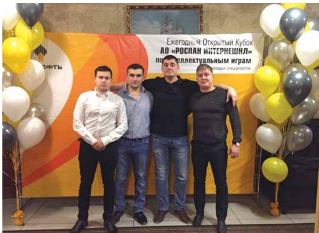
Команда ЗПКТ «Содружество» впервые приняла участие в интеллектуальной битве