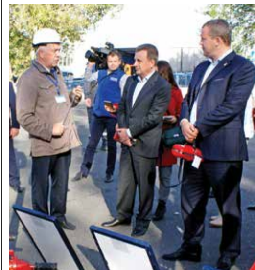
Визит врио губернатора Астраханской области

Два других проекта были представлены в номинации «Лучший проект в области разработки программного обеспечения и баз данных».