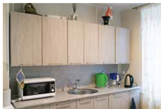
Кухня, как дома