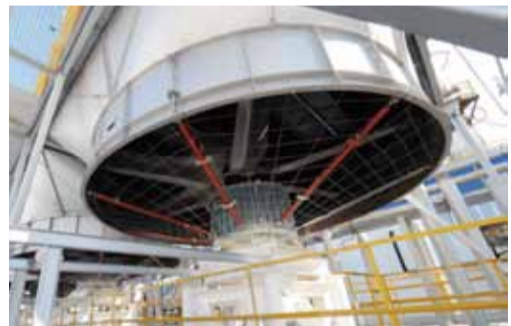
Аппараты воздушного охлаждения установки получения пропан-бутана

для технологических установок ЗПКТ, как и газовый конденсат с неокотских залежей Заполярного НГКМ, освоение которых с 2011 года обеспечивает ООО «Газпром добыча Ямбург».