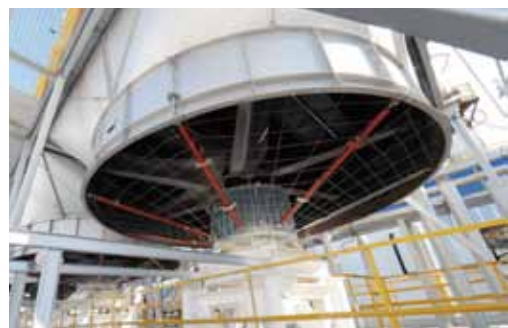
Аппараты воздушного охлаждения установки получения пропан-бутана

для технологических установок ЗПКТ, как и газовый конденсат с неокотских залежей Заполярного НГКМ, освоение которых с 2011 года обеспечивает ООО «Газпром добыча Ямбург».