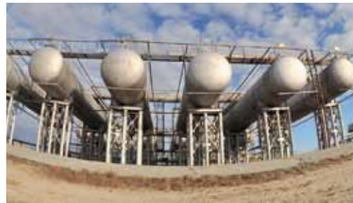
Буллиты головной насосной станции