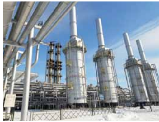
Трубчатые печи установки дезанизации конденсата