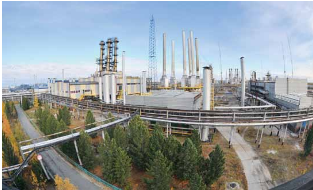
Технологический комплекс ЗПКТ

ЗАВОД ПО ПОДГОТОВКЕ КОНДЕНСАТА К ТРАНСПОРТУ ОТМЕЧАЕТ ЮБИЛЕЙ