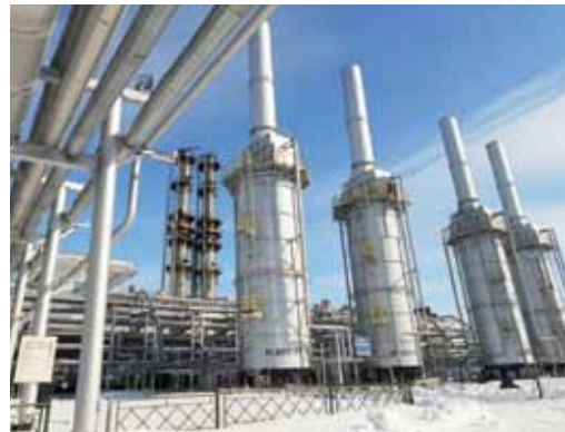
Трубчатые печи установки дезанизации конденсата