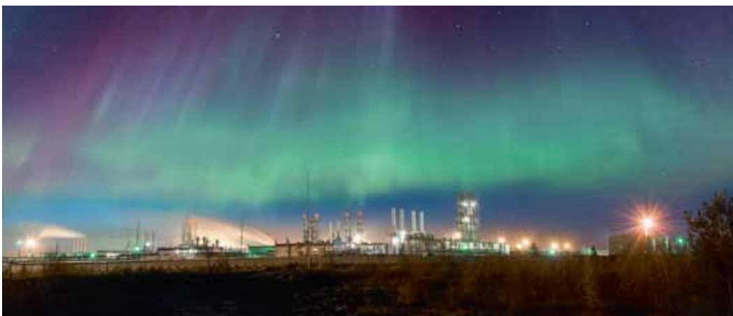
Северное сияние на ЗПКТ

– Наш завод является единственным предприятием ОАО «Газпром» перерабатывающего профиля в ЯНАО, которое обеспечивает не только подготовку к транспорту сырья на Сургутский ЗСК. Производственный процесс добычи газа в регионе и производственный комплекс переработки газового конденсата на ЗПКТ – взаимосвязанная технологическая цепочка, где завод является важнейшим звеном. Это красноречиво подтверждается географией поставщиков углеводородного сырья. В настоящее время на завод поступает нестабильный газовый конденсат неокотских залежей Уренгойского, Ямбургского, Северо-Уренгойского, Ен-Яхинского НГКМ. С июля 2008 года от ЗАО «Ачимгаз» на установку дезанизации конденсата № 1 стал поступать нестабильный конденсат ачимовских залежей Уренгойского НГКМ. Этот конденсат отличается большим содержанием тугоплавких высокомолекулярных парафинов, но от этого он не менее ценный. С 2009 года организована подача на УДК-1 ачимовского конденсата с еще одного технологического объекта Уренгойского НГКМ – УКПГ-22 ООО «Газпром добыча Уренгой». Принимая во внимание продуктивность и объемы залегающих запасов углеводородов ачимовских пластов, именно этот конденсат является основным сырьем на долгосрочную перспективу