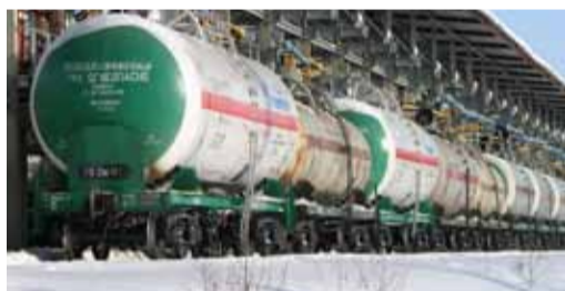
Отгрузка продукции на Сосногорском ГПЗ

Было отмечено, что к настоящему времени компаниями согласован план-график мероприятий по реализации проекта, утверждена технологическая схема при-