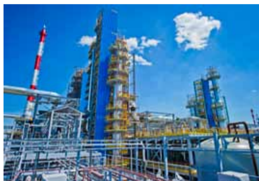
Производственные мощности ОАО «Газпром нефтехим Салават»

На основании решения Общего собрания акционеров ОАО «Газпром нефтехим Салават», состоявшегося 20 января 2014 года, полномочия единоличного исполнительного органа ОАО «Газпром нефтехим Салават» переданы управляющей организации – ООО «Газпром переработка», о чем свидетельствует запись, внесенная в Единый государственный реестр юридических лиц 28 января 2014 года.