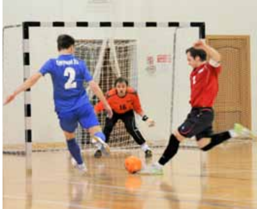
Борьба за первое место в мини-футбольном турнире