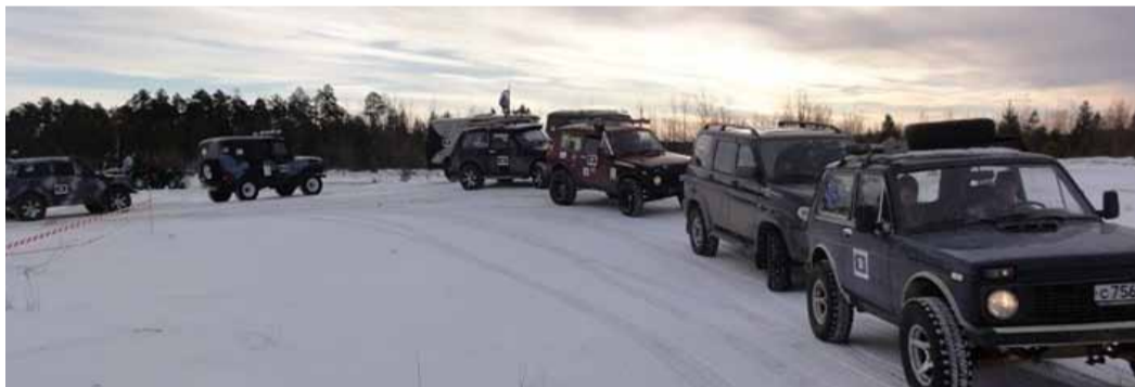
На закрытии зимнего спортивного сезона 2012 года Клуба технических видов спорта.

Работники ООО «Газпром переработка» отправятся в автопробег