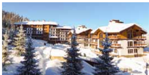
Горная олимпийская деревня для лыжников и биатлонистов на 1100 мест. После сезона 2014 года она станет гостиничным комплексом для гостей горно-туристического центра (ГТЦ) ОАО «Газпром».

«Газпром» полностью выполнил олимпийскую инвестиционную программу. С 2007 года были построены Адлерская теплоэлектростанция (ТЭС), газопровод «Джубга – Лазаревское – Сочи», лыжно-биатлонный комплекс на хребте «Псехако», горная олимпийская деревня для лыжников и биатлонистов, горно-туристический центр, а кроме того – общественно-культурный центр «Галактика», новые сооружения горнолыжного курорта «Альпика Сервис» и многое другое.